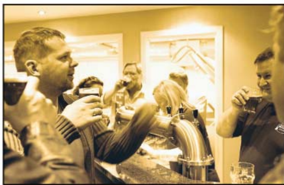
Amager Bryghus blev indviet med manér.

De to stolte bryggere lægger ikke skjul på deres forkærlighed for amerikansk specialøl - ofte en kraftigt humlet og